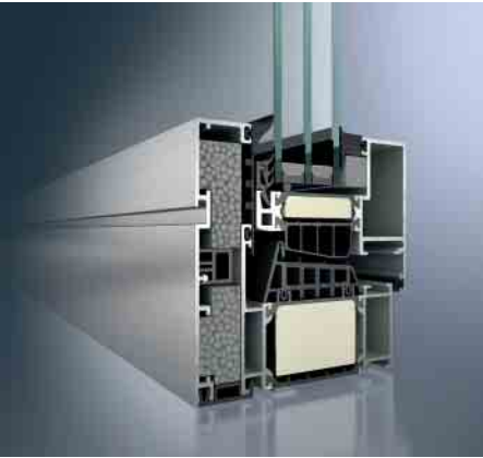
Schüco Fenster AWS 112.IC Schüco window AWS 112.IC